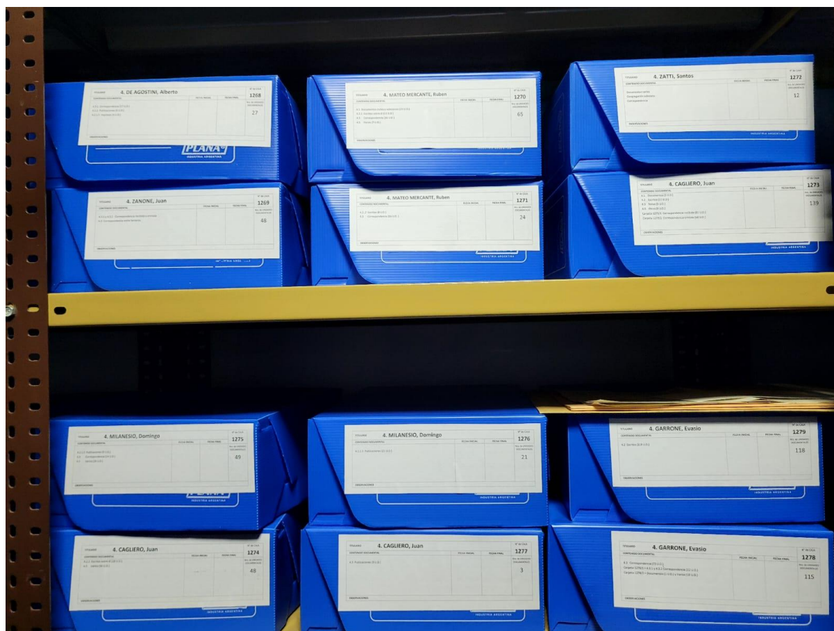
Imagen 1: Fondos de personas identificados con un frente de caja, instalados en estanterías metálicas