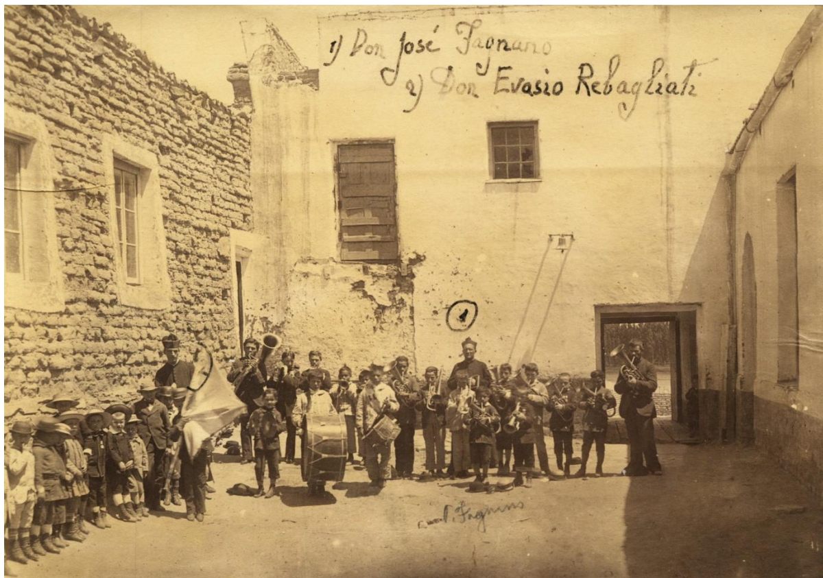
Imagen 4. Fotografía 4.4. FJ. (Ca. 1880) Patagones. AR-AHS ARS/BB.